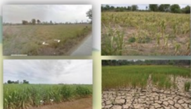
ภาพจาก Google street view เป็นการเลือกชมภาพจากสถานที่จริง