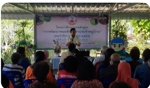
ขอบคุณข้อมูล สมาคมแม่น้ำเพื่อชีวิต

ผลิตสิ่งพิมพ์ วีดีโอ โปสเตอร์ จัดงานเปิดตัวงานวิจัย